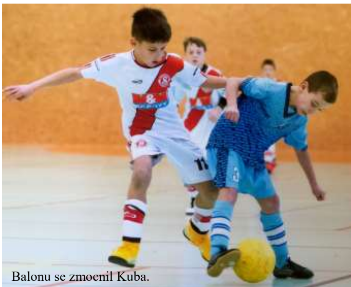
Balonu se zmocnil Kuba.